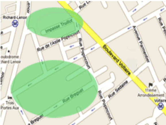
Plans des sites: